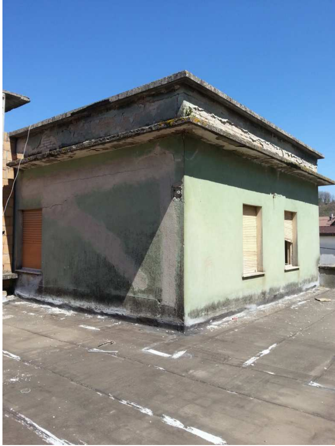
VISTA DA TERRAZZO DI COPERTURA