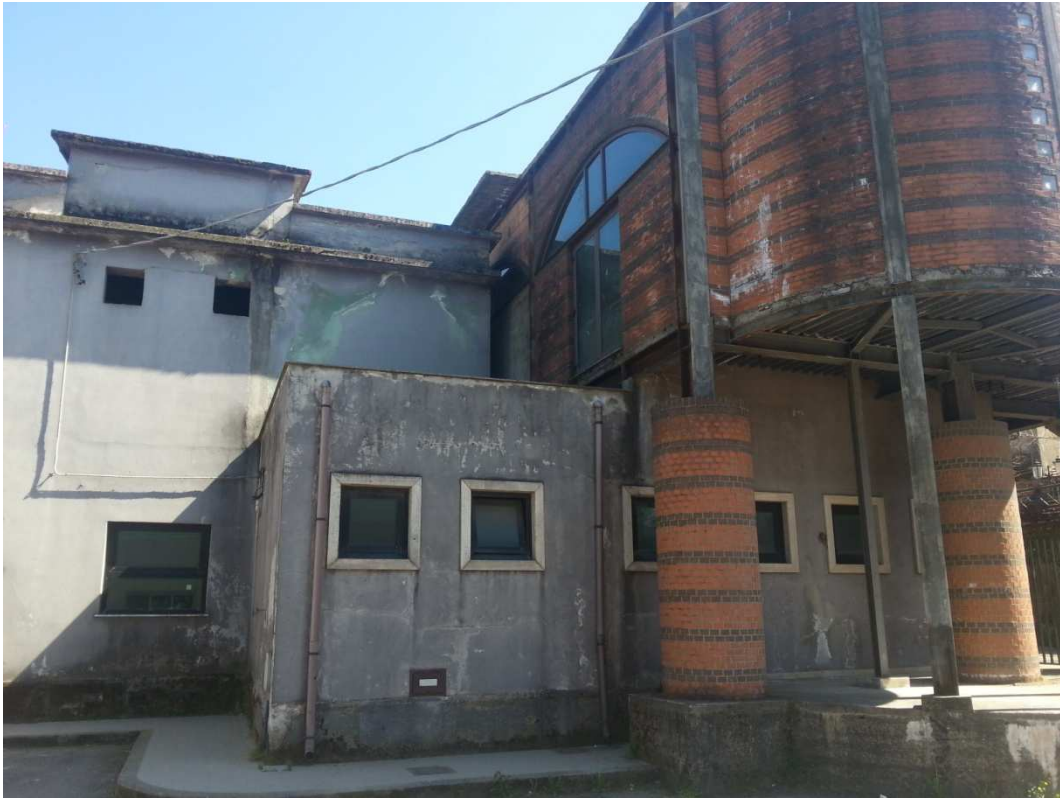
PROSPETTO LATO SINISTRO