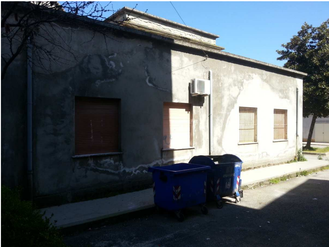
PROSPETTO LATO DESTRO