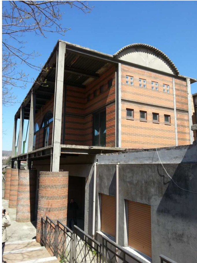
VISTA PROSPETTO LATO DESTRO