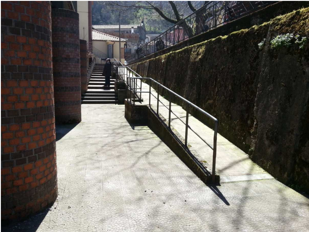
VISTA RAMPA E SCALINATA DI ACCESSO DAL PROSPETTO SU VIALE ROMA