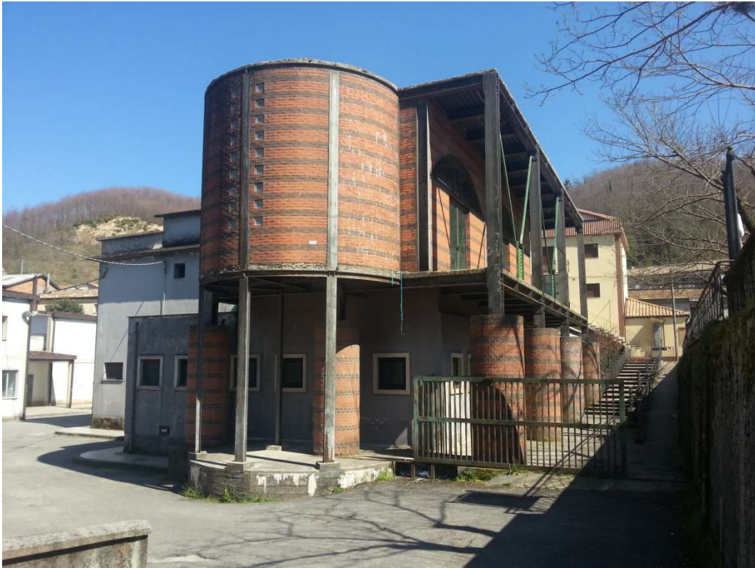
PROSPETTO LATO SINISTRO E PROSPETTO SU VIALE ROMA