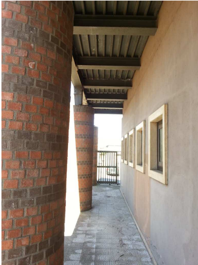
VISTA SU PASSAGGIO SOTTO IL BALLATOIO