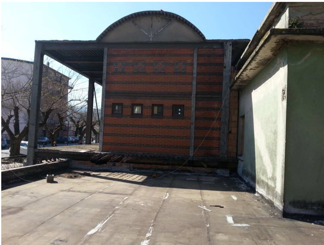
VISTA DA TERRAZZO DI COPERTURA