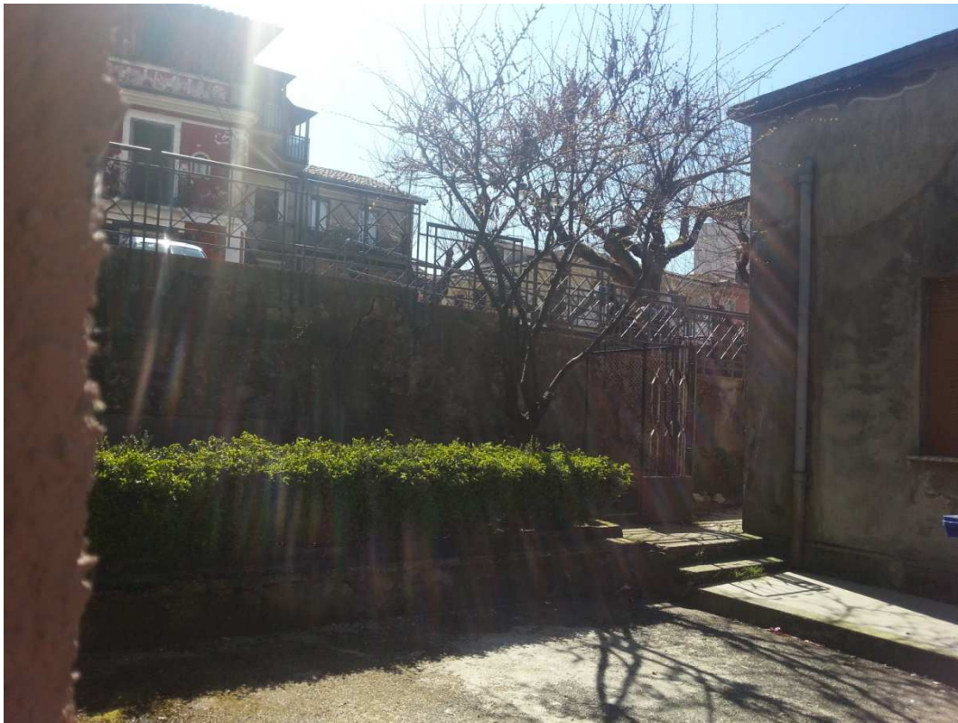
VISTA PARTICOLARE AREA VERDE E CANCELLETTO DI ACCESSO PROSPETTO LATO DESTRO