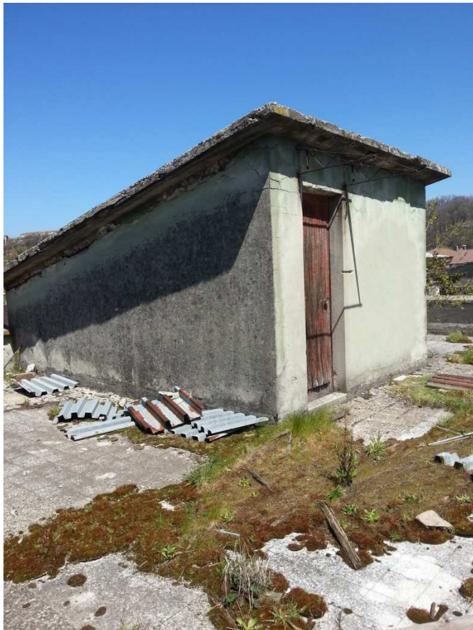
VISTA DA TERRAZZO DI COPERTURA