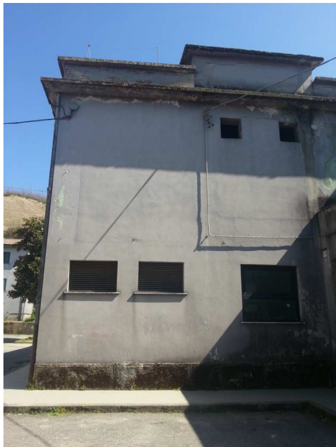
PROSPETTO LATO SINISTRO